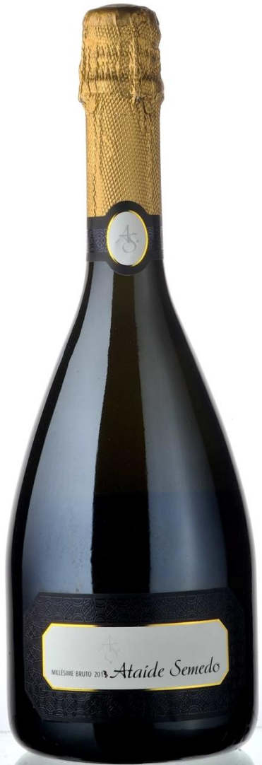
Ataíde Semedo Millésime Bruto, 2013 ATAÍDE COSTA MARTINS SEMEDO UNIP. LDA.