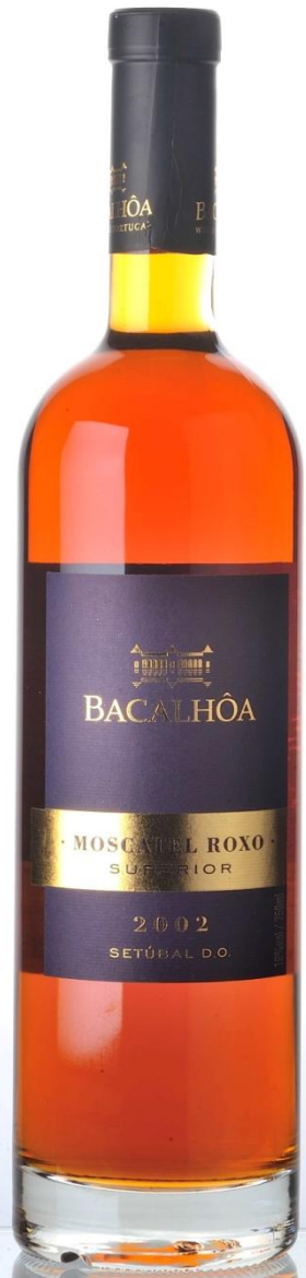
Bacalhôa Moscatel Roxo Superior, 2002 BACALHÔA VINHOS DE PORTUGAL