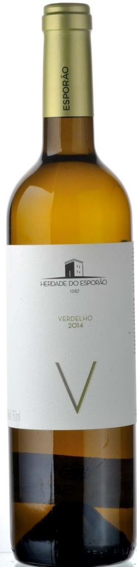
Herdade do Esporão Verdelho, 2014 ESPORÃO SA