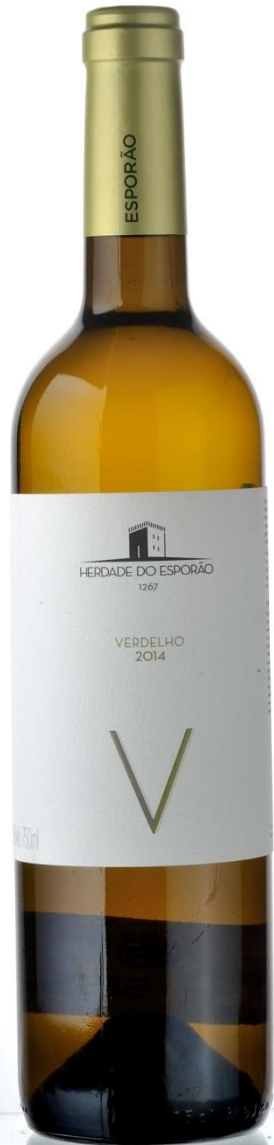
Herdade do Esporão Verdelho, 2014 ESPORÃO SA